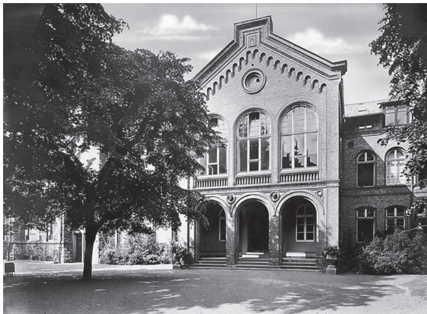
Abb. 2: Auguste Viktoria-Schule Ansicht von Süden (Viktoria-Str.)